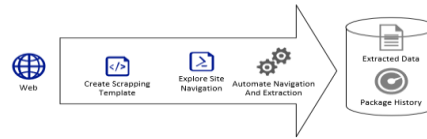
Gambar 2.1 Langkah Web Scraping