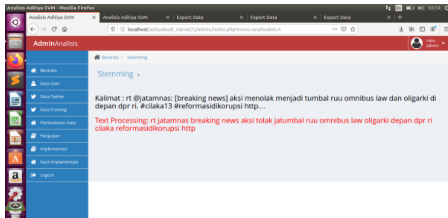
Gambar. 4.2 Hasil Stemming

Pada halaman ini menampilkan hasil dari sebuah komentar yang telah di pilih dari data training . Hasil nya berupa penghilangan kata imbuhan, kata-kata tidsk penting, angka dan emoticon selain huruf abjad, dan menjadikan nya kata dasar.