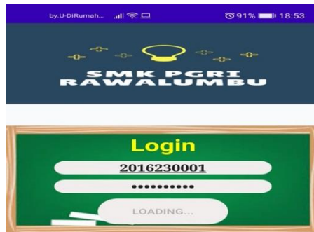
Gambar 1. Tampilan Login Aplikasi