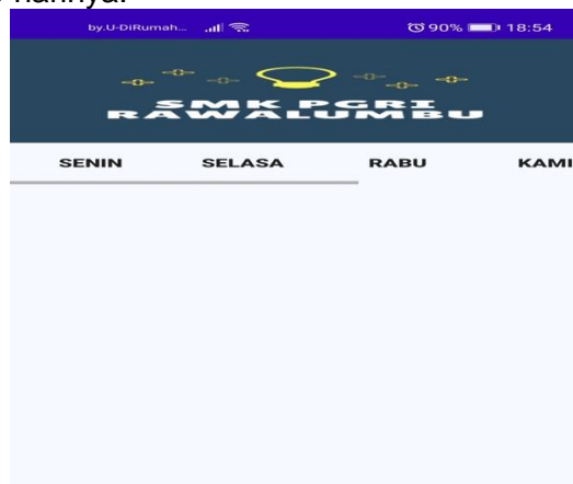
Gambar 5. Tampilan Jadwal Pelajaran

Dibawah ini merupakan tampilan jadwal pelajaran. Dimana siswa dapat melihat jadwal pelajaran setiap harinya.