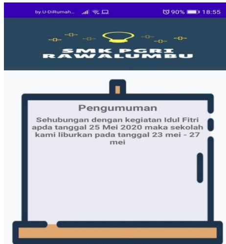
Gambar 4. Tampilan Pengumuman

Dibawah ini merupakan tampilan pengumuman. Dimana siswa dapat melihat informasi kegiatan belajar mengajar di sekolah.