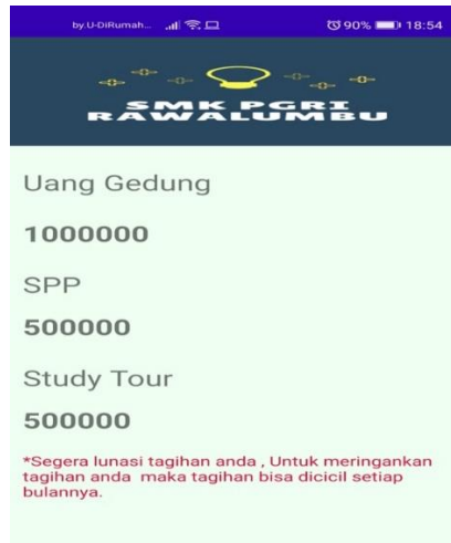
Gambar 6. Tampilan Tagihan