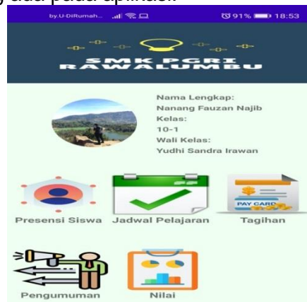
Gambar 2. Home

Dibawah ini merupakan tampilan home pada aplikasi ini. Dimana pada halaman ini berisi menu menu yang ada pada aplikasi.