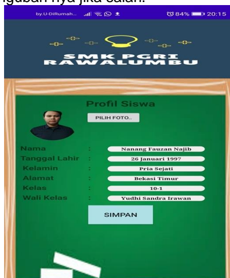
Gambar 3. Tampilan Presensi Siswa

Dibawah ini merupakan tampilan presensi siswa. Dimana siswa dapat melihat informasi pribadi dan mengubah nya jika salah.